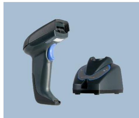
Mobile Reader et stand QuickScan